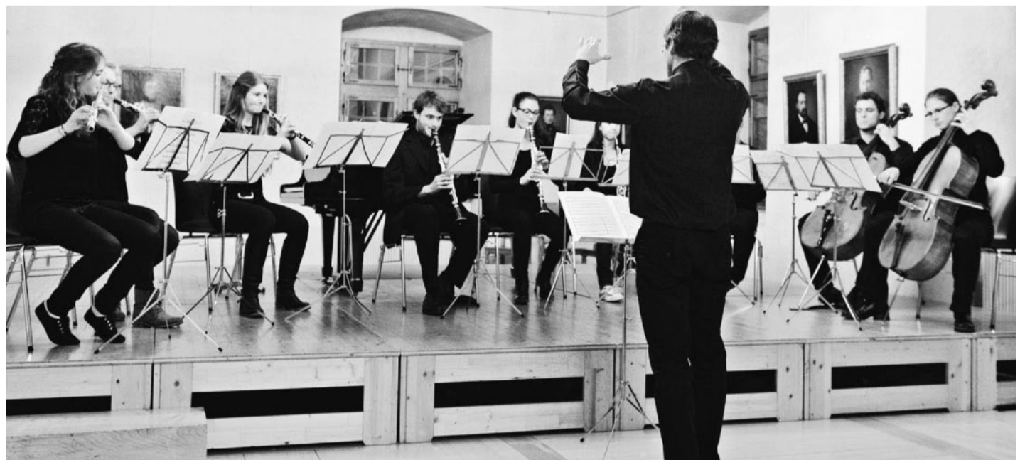
Für gute Zwecke. Das «Spirit Chamber Orchestra» des Kollegiums Spiritus Sanctus setzt sich mit seinem Konzert für «Musique et Vie» ein.

nen, die sich für Frieden, Menschenrech- te und die Jugend in gesellschaftlich be- nachteiligten Kreisen einsetzen. Dieses Jahr wird auf das 30-jährige Engagement der Organisation «Musique et Vie» hinge- wiesen: Diese Institution trägt die ver- schiedensten musikalischen Ausdrucks- formen in unterprivilegierte und länd- liche Gegenden sowie in Spitäler und Gefängnisse. | wb