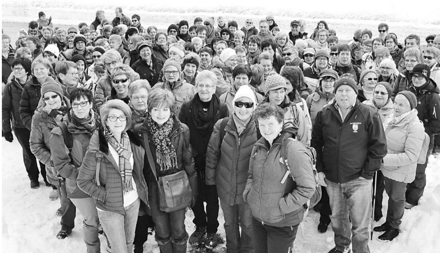
Reges Interesse. Am Langlauf- und Wanderplausch in Münster war eine Grosszahl Mitglieder dabei.

ebenfalls angekommenen fleissigen Langläufern mit einem Gläschen an. Anschliessend machten sich die Teilnehmer bei leichtem Schneefall auf den Rückweg ins Landhaus nach Münster. Dort wurden sie mit einem hervorragenden Zvieri-Büfett kulinarisch verwöhnt. So gestärkt begab man sich dann um 16.25 Uhr mit der MGB bestens gelaunt und versorgt nach Hause. Die Organisatoren bedankten sich abschliessend bei den Mitgliedern für die rege Teilnahme an den verschiedenen Wintersportanlässen. | wb