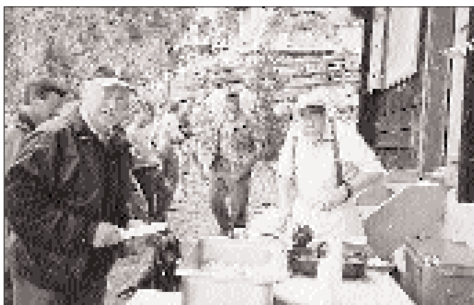
Verdienter Lohn nach getaner Arbeit.

feierliche Prozession, die Vesper am Nachmittag und die Fahnenrückgabe mit Ehrenwein wurden von den schweizerischen Gästen mit viel Interesse und Bewunderung betrachtet. Man war sich vollauf bewusst, dass ein Segenssonntag nicht eine Schau, sondern ein religiöses Ritual bedeutet, welches mit dem nötigen Anstand betrachtet wird. Fronleichnam und Segenssonntag haben wesentlich dazu beigetragen, dass die Ahnenmusiktradition im Oberwallis überhaupt überleben konnte. Heute stehen die 26 Sektionen in den verschiedenen Oberwalliser Gemeinden gefestigt da und beteiligen sich rege und mit Engagement am dörflichen und religiösen Leben. Die Veteranentagung in Visperterminen wird den Gästen in allerbesten Erinnerung bleiben und war auch schönste Werbung für das Oberwallis, für Visperterminen und die traditionsreiche Ahnenmusik.