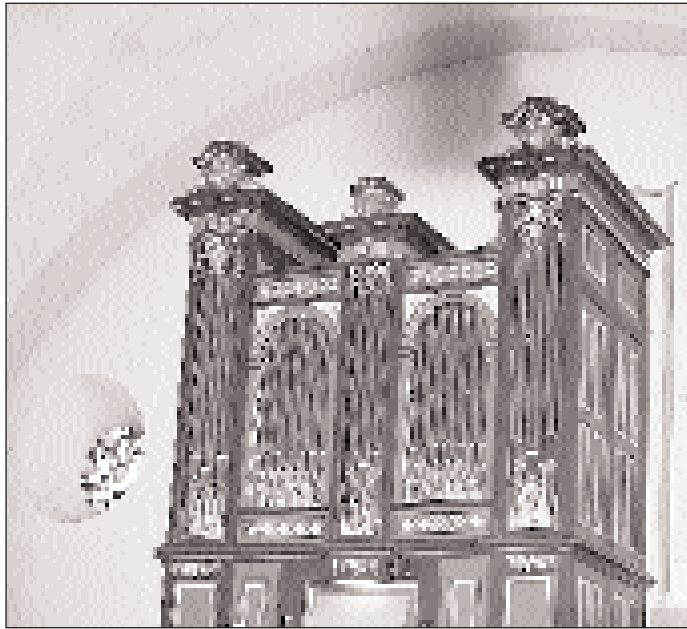
Die neue Orgel von Zeneggen ertönt am kommenden Samstag erstmals ausserhalb des Gottesdienstes.