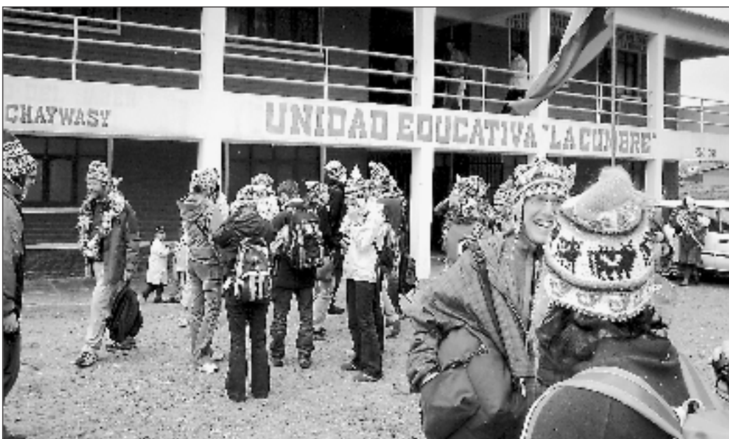
Die Spirit Singers vor der Schule in Cochabamba auf 3000 m ü. M.