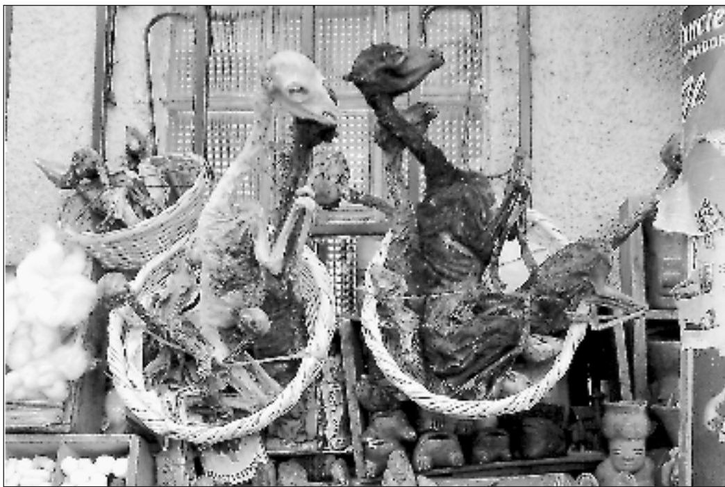
Getrocknete Lama-Föten auf dem «Hexenmarkt» in La Paz.

Die Konzertreise nach Bolivien hat eine lange Geschichte. Sie begann vor zwei Jahren. Damals begegnete Chorleiter Ste-