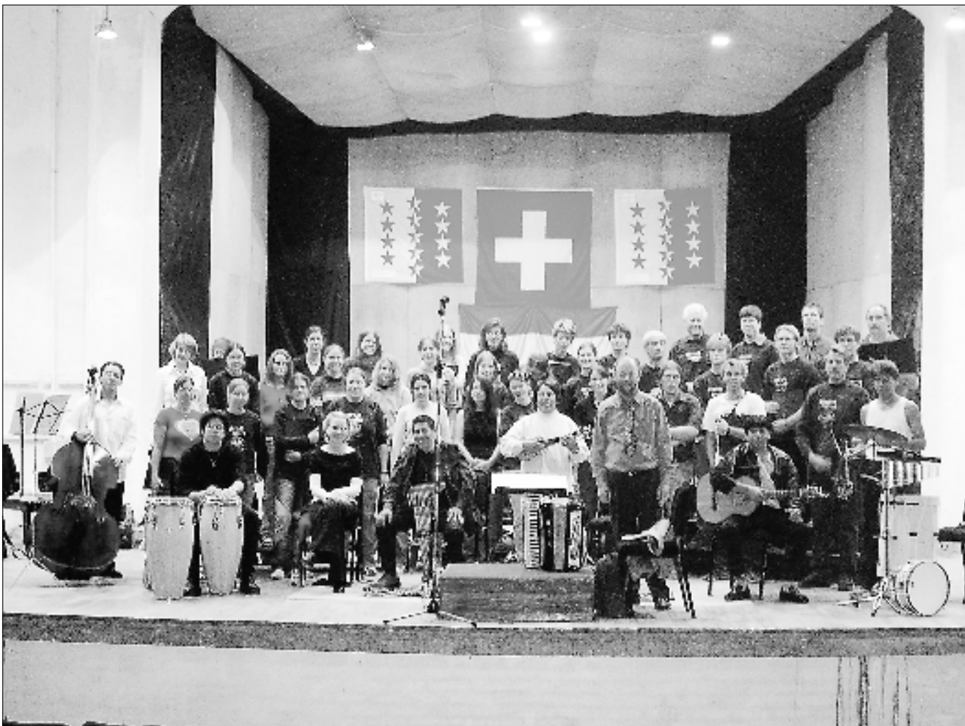
Konzertauftritt der Spirit Singers in Bolivien.