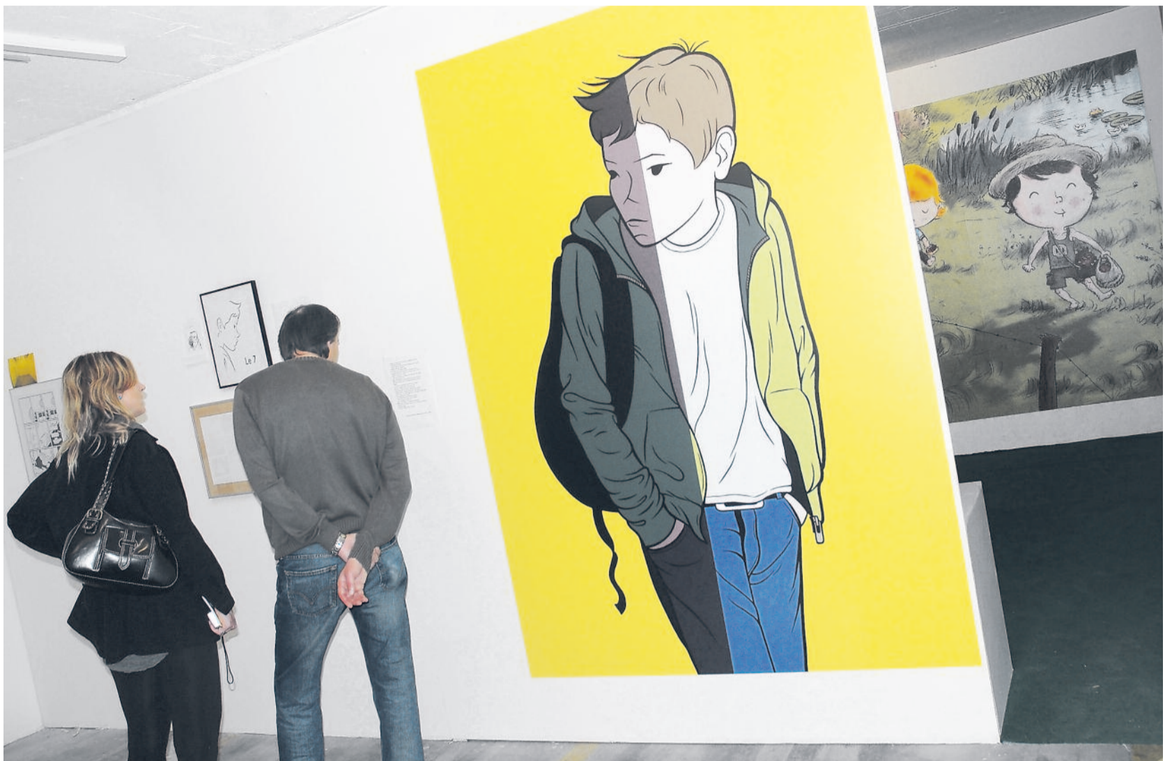
Blicke begegnen sich – und im Hintergrund wird Fröhlichkeit sichtbar.