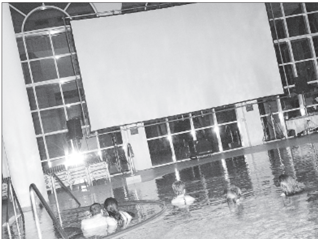
Die zweite Serie von «Kino im Pool» beginnt am 16. März in der Lindner Alpentherme zu Leukerbad.

Es sind dies die Streifen vom 17., 18. und 25. März.