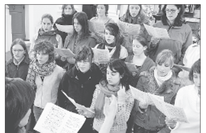
Rund 30 engagierte Jugendliche belegen am Briger Kollegium das Hauptfach «Musik».