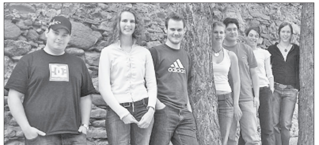
Dieses Septett musiziert am Freitagabend im Theatersaal des Briger Kollegiums.