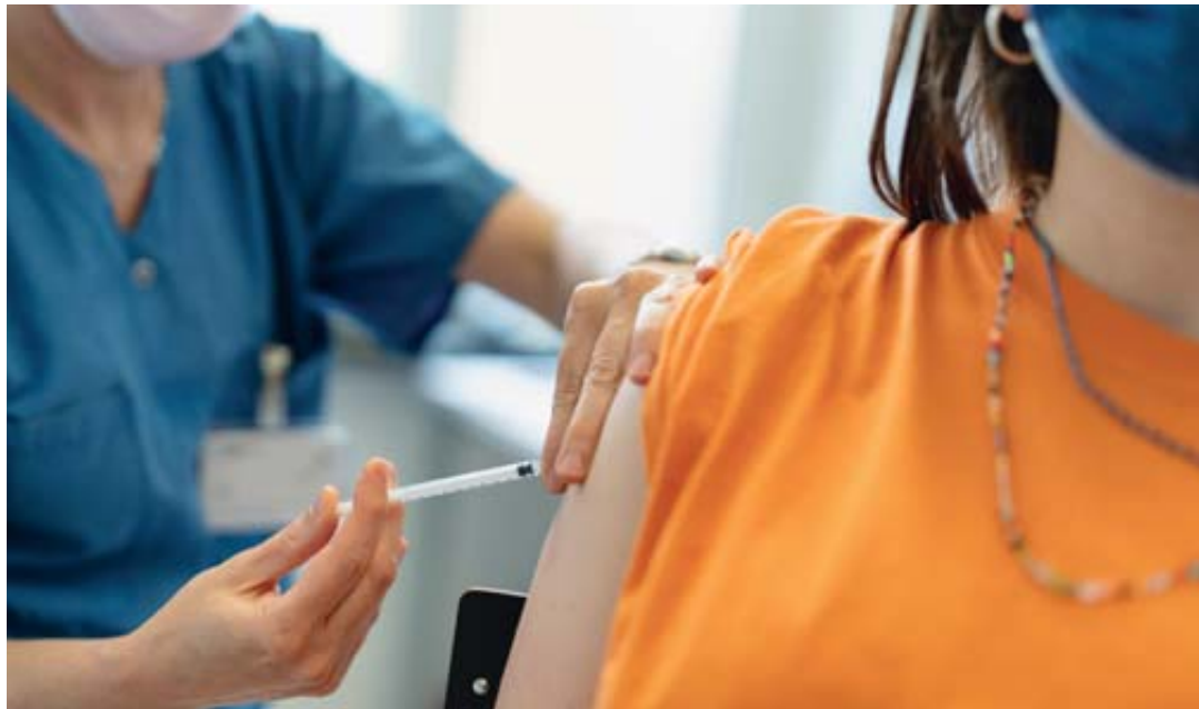
Cet automne, les jeunes Valaisans bénéficient d'une possibilité supplémentaire de se faire vacciner contre le Covid grâce à l'action commencée dès cette semaine dans les établissements de secondaire II.

En 2020, «le coronavirus a été source de grande inquiétude chez les personnes touchées par le cancer», note la Ligue valaisanne contre le cancer dans son rapport annuel: 633 personnes touchées se sont adressées à elle pour obtenir des informations ou un appui organisationnel ou financier. Par contre, le service de transports de patients a vu ses prestations fortement réduites en raison de la crise sanitaire, passant de 183 000 à 116 000 km parcourus. Pour répondre à l'urgence, et pour contourner la difficulté du confinement, des offres numériques ont été mises en place. Les soutiens financiers ont aussi été augmentés, pour atteindre 354 800 francs (+11,3%). La ligue a pu faire face à ces demandes grâce aux dons. Le cancer est la deuxième cause de mortalité en Valais, après les maladies cardiovasculaires. Un Suisse sur trois doit faire face à un diagnostic de cancer à un moment de sa vie. JYG