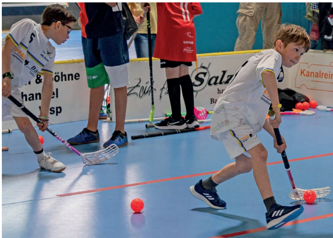
Der Nachwuchs am Ball, 18 Teams sind an der Floorball Trophy in Visp dabei.

Viele Neuigkeiten und ein grosses Teilnehmerfeld beim Unihockey-Turnier der Junioren in Visp.